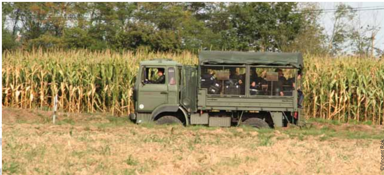
Tarn-et-Garonne, août 2007 : champs de maïs sous la surveillance de l'armée.

Le gouvernement ne s'en remet qu'aux simples recommandations des organismes professionnels favorables aux OGM, en particulier l'AGPM, qui est clairement un lobby pro-OGM. Les pratiques recommandées par le Ministère de l'Agriculture se réfèrent au « guide des bonnes pratiques », conçu par l'AGPM sans que les syndicats représentant les agriculteurs potentiellement victimes des