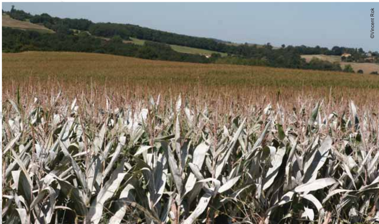
Gers, septembre 2007 : une parcelle OGM non déclarée est découverte par Greenpeace.

Le Ministère de l'Agriculture recommande aux cultivateurs d'OGM d'informer leurs voisins. Mais cette recommandation n'est pas une obligation : elle en appelle à la seule « responsabilité de l'agriculteur ». Sur le terrain, tous les témoignages s'accordent pour dire que cette recommandation est très peu suivie : la loi du secret prévaut. Par conséquent, la méfiance s'installe dans les villages et de nombreux conflits de voisinage éclatent, dans une ambiance lourde de suspicions. Le plus souvent,